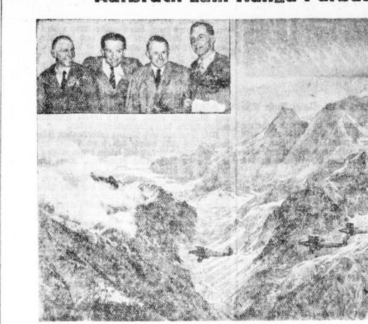
Von München ist die Vorhut der deutschen Himalayaexpedition abgegangen, die es sich zum Ziel gesetzt hat, den 8120 Meter hohen Nanga Parbat zu bezwingen.