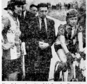
Von links nach rechts: Schindler, der Sieger des Stundenrenns...