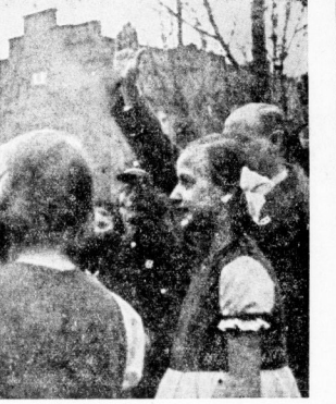
Empfang des Landesbischofs durch die Luthergemeinde