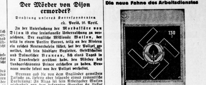
Die neueste Ausgabe der Zeitschrift „Deutscher Arbeitsdienst“ zeigt die neue Abteilungsflagge des Arbeitsdienstes, die das Hakenkreuz mit den Emblemen des Arbeitsdienstes in glücklicher Weise vereint hat.

Drabung uneres Korrespondenten ck. Paris, 16. April.