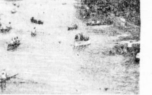
Zentrale wackerten, um die Aufsicht zu geben, viele...