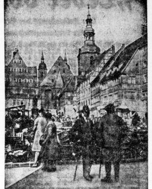
Marktag in Eisleben