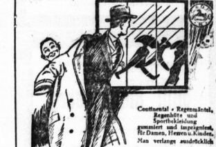
Continental Regenmantel, Regenkleid...