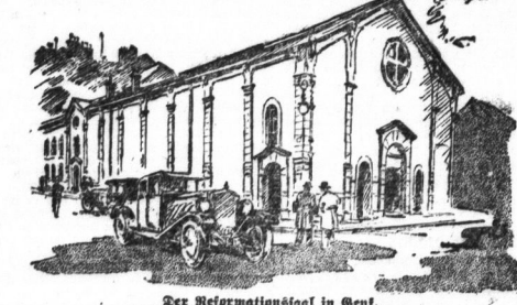
Der Reformationsrat in Genf, der für die Vollversammlung des Völkerbundes berufen wird.

Der Ratifikation und die Münzungsfrage. Am 9. März. (Einschaltung unter dem Namen des Verfassers der Redaktionen). Die Genfer Konferenz, die sich bisher ausschließlich auf die Hauptfrage des Kohlenbrennstoffes beschränkte, hat am 8. März im Hinblick auf die Entscheidung über die Hauptfrage des Kohlenbrennstoffes beschlossen, dass die Kohlenbrennstofffrage dem Ausschuss für die Kohlenbrennstofffrage überlassen wird.