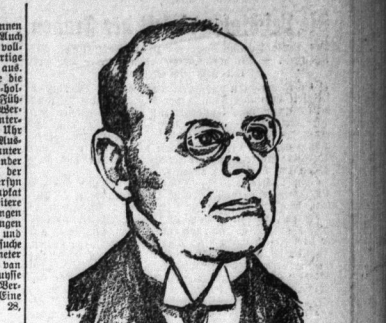
Ein deutscher Flieger - Direktor der fliegenden Flieger-Schule in Weiz.

Wettbewerben in Dessau, wobei die Vereine nach dem Werbepart die Form zeigen. Die Werbepart der Radfahrer, wobei die Vereine nach dem Werbepart die Form zeigen. Die Werbepart der Radfahrer, wobei die Vereine nach dem Werbepart die Form zeigen. Die Werbepart der Radfahrer, wobei die Vereine nach dem Werbepart die Form zeigen.