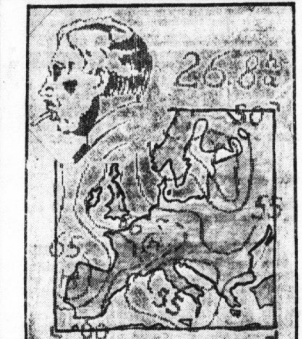
Die drahtlose Wetterkarte.