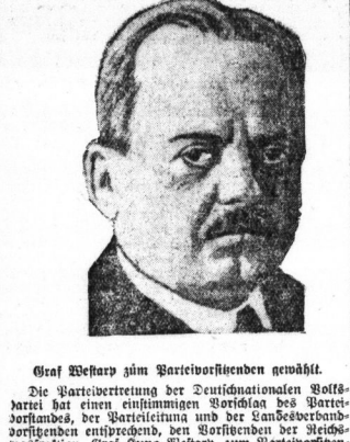
Graf Wehner zum Parteivorstand gewählt.