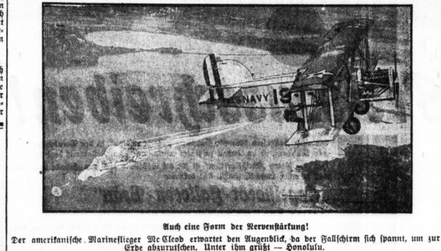
Die amerikanische Marineflieger... Die amerikanische Marineflieger...