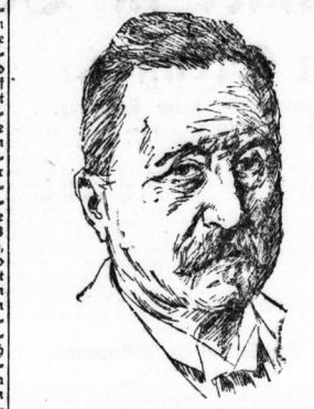
Mitglied des Reichstages.

B. Berlin, 27. März. Am Reichstag will man doch noch vor der Ratung des Arbeitsprogramm bewilligen. Heute soll immer zu treuen nehmen und die bisherige geistlichen Zustände nicht also wieder. Ein einzelner Brief, ein jeder kurz werden zuletzt doch immer am besten zum Geschehen führen.