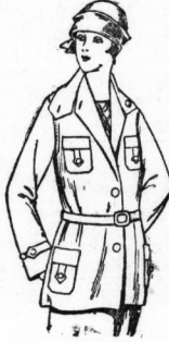
Windjacke It. Bild, aus gutem wärmerhaltendem Stoff 8.90