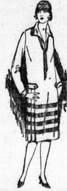
Bordüren-Kleid It. Bild mit modern. Faltenrock u. d. einfarb. Kravatte 19.50