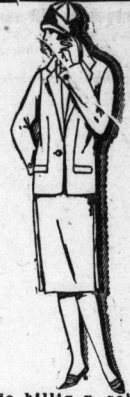
No billig u. schön Ripps-Jackenkleid It. Bild vom u. gute Verarbeitung, Jacke mit buntem Foulard gefüttert 29.75