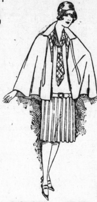
Das Cape-Complet It. Bild Die vord. Kleidung, herrl. farb. m. weit. Plüschrock 29.75