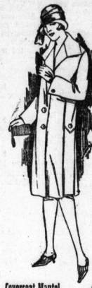
Covercoat-Mantel It. Bild moderne Glockenform 8.50