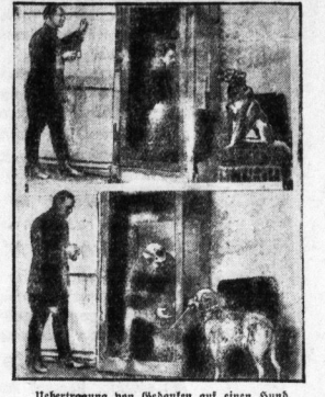
Übertragung von Gedanken auf einen Hund.

Nach im vorigen Jahrhundert war die Erfindung offener Phänomene mit dem Schiefer der Physik unläugbar. Jäherntausende deuteten ihre „übernatürlichen“ Fähigkeiten, um sich die Zeichen zu füllen, und Phänomene gründen Götter und geheime Orden, die die seltsamen Lehren damit verknüpfen. Diese Art von Beschäftigung mit dem Problem der Gedankenübertragung