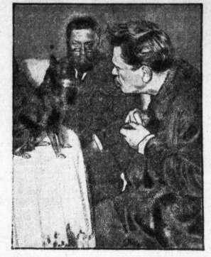
Die Hefe Spielmann.

Ein Sondereinsatz in Halle war vor 8 Jahren unter dem Namen „Hefe Spielmann“ bekannt. Die Hefe Spielmann war ein Sondereinsatz in Halle war vor 8 Jahren unter dem Namen „Hefe Spielmann“ bekannt.