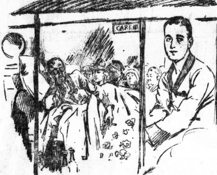
Sally hat's geschafft.

Wetter am 31. März. Amliche Nachrichten der Wetterdienststelle Magdeburg.