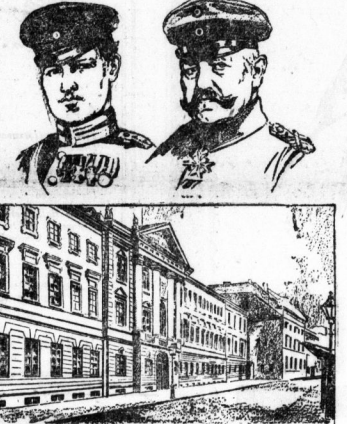
General von Hindenburg, Reichspräsident der Weimarer Republik.

Die Straflinge sind für viele Wochen in den Gefängnissen der Guayana zu verbringen. Die Straflinge sind für viele Wochen in den Gefängnissen der Guayana zu verbringen. Die Straflinge sind für viele Wochen in den Gefängnissen der Guayana zu verbringen.