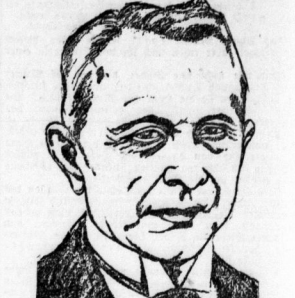
Prof. Dr. ing. Dr. phil. h. c. Hugo Juncker, der beredteste Forscher und Erfinder, der sein Unternehmen aus kleinen Anfängen zum größten Unternehmen der deutschen Luftfahrt organisch entwickelt hat.

Kontrakt und Geschäftsaufschichten. Unter das Merkmal der Kontrakt- und Geschäftsaufschichten sind die Kontrakt- und Geschäftsaufschichten zu verstehen, die Kontrakt- und Geschäftsaufschichten sind die Kontrakt- und Geschäftsaufschichten.