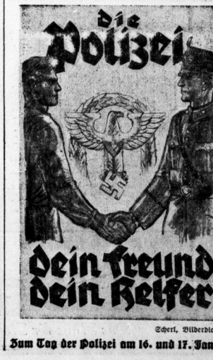
Zum Tag der Polizei am 16. und 17. Januar