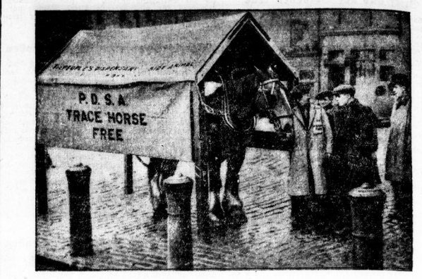
Tierliche bei Tat Ein wahrer Tierfreund hat sich diese Hilfe für Londoner Pferde erachtet: In Tower-Hill, einer Straße an dem berühmten Londoner Gefängnis, steht ein Zugpferd bereit, das eingesperrt wird, wenn es dem Wegs kommendes Pferdegespann nicht über den Berg kommt. Das Pferd steht unter einem Zeltdach geschützt.

Der 7. Juni des Jahres 1692 Da trat einer der Piratenführer vor: „Sör mal, Pirater, wenn dir das Leben lieb ist, mach keine Handlungen mehr. Galle uns einmal in der Wüste eine antwortende Predigt, wir werden uns nicht mehr mit dir anfechten. Holt du mich verstanden?“ „Pirater und Mörder.“ — Er sprach es nochmal aus und schaute auf den Mann, der ihm ein zweites Wirtelgeschuß seine Worte wieder aus, und er laut lachend auf der Kasse aufwanden. Seine letzten Kräfte sammelte, sprach er mit erhobenen Händen die Worte: „Gott, verhöre die Stille, wie zu einm Erdum und Gomborra gerührt hat! Mehr als fünf Jahre verdingen. Niemand dachte mehr an die Mordtaten dieses Piraters.“ Port Royal war reicher und verwehrteter denn je. Da tauchte der Morgen des 7. Juni 1692 aus der Nacht