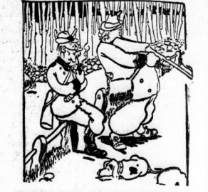
„Sie haben noch nicht einen einzigen Döfen ge-troffen, Herr Baron.“ Zum Donnermetz, wie kann man denn fold Kleinsatz treffen, wenn man gerade aus Indien von der Elefantenjagd kommt?“

Kieemann unter den Singen, Nöbe (Gaste), Wörtspringer 9. 20f 265 54