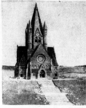
So sah es vor vierunddreißig Jahren aus — Die Zeppelinstraße im Aufbau