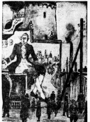
Originalzeichnung: Kurt Martoh