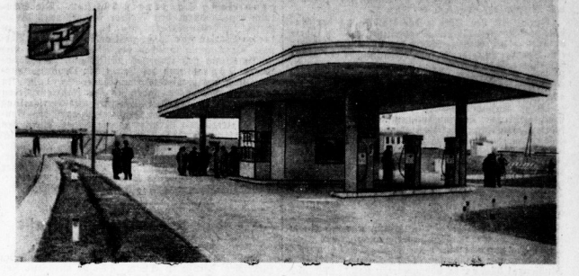
Am Sonnabend wurde an der Reichsautobahn Schweiditz-Nürnberg...