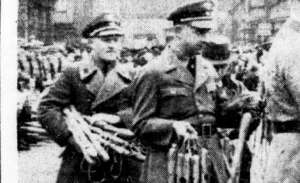
Ueberreichung der Knotenstücke an die Handwerksgelesen.

72 Gefellen gingen auf die Wanderschaft - Zum ersten Mal sind auch die Freizeiter dabei. Feiertliche Verabschiedung auf dem Hallmarkt. Die Entwicklung des Flughafen als glänzende Verwirklichung verkehrspolitischer Gesichtspunkte ist ein Beispiel für die weitsehende Luftverkehrspolitik der Stadt Halle.