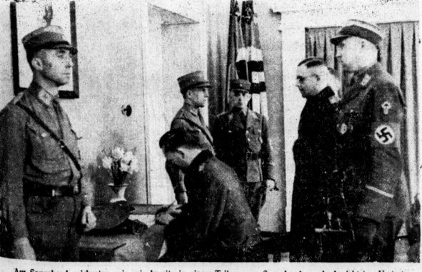
Am Sonntag zeichnen, wie wir bereits in einem Teil unserer Sonnabendausgabe berichteten, Vertreter der hallischen Truppendeile im Ehrensaal der SA-Brigade 3 Spenden für das Dankopfer der Nation in der dort ausliegende Ehrenliste ein. Unser Bild zeigt den Einzugszug.