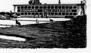
Die erste Skizze vom Flughafen Halle-Leipzig aus dem Jahre 1928.

der Gruppe der von Ostpreußen nach Nordwesten gerichteten Weltverkehrswege. Er bietet meteorologisch den Vorteil, daß im Herbst und Winter die Bodenbedeckung der Erde, Schnee und Eis, die Landung nicht abgibt. Halle ist ein Zentrum für den Luftverkehr in der Region. Die Entwicklung des Flughafen als glänzende Verwirklichung verkehrspolitischer Gesichtspunkte ist ein Beispiel für die weitsehende Luftverkehrspolitik der Stadt Halle.