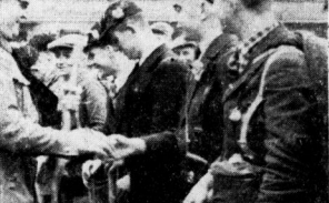
Ueberreichung der Knotenstücke an die Handwerksgelesen.

72 Gefellen gingen auf die Wanderschaft - Zum ersten Mal sind auch die Freizeiter dabei. Feiertliche Verabschiedung auf dem Hallmarkt. Die Entwicklung des Flughafen als glänzende Verwirklichung verkehrspolitischer Gesichtspunkte ist ein Beispiel für die weitsehende Luftverkehrspolitik der Stadt Halle.