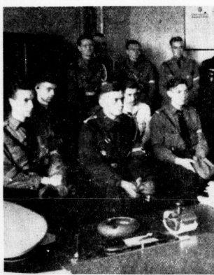
Empfang der Reichssieger durch den Gauleiter-Stellvertreter.

Die Fahnenführung und die Ausgabe der Ehrenurkunden und die Drangfänger des Reichsarbeitskampfes beenden diese überaus ein- drucksvolle Kundgebung auf dem Rosplass. Er wird nun reich geräumt, um für die Großkundgebung in der Mittagsstunde frei zu werden.