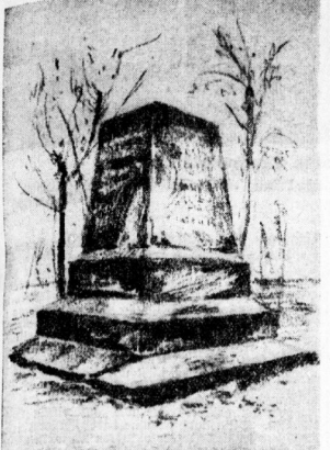
Elisabethdenkmal auf dem "Bierbügel" bei Salzmünde

Jährlich am Himmelfahrtstage feiern die Dörfer Goresleben, Goresleben, Goresleben, Goresleben und Salzmünde ihr "Himmelfahrtsfest". Die Feste gründet sich auf eine Sage, die bis ins 18. Jahrhundert zurückgeht. Als der Landgraf Ludwig IV. von Thüringen, der während des Jahres 1217 bis 1227 regierte, mit dem Kaiser Friedrich II. zum Kampf gegen die Türken zog, hinterließ er seine Gemahlin Elisabeth auf der Wartburg.