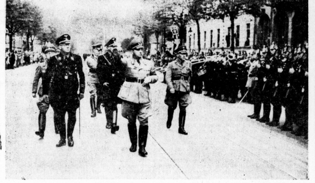
Reichsstatthalter Gauleiter Jordan schreitet in Dessau die Front der Schutzpolizei ab