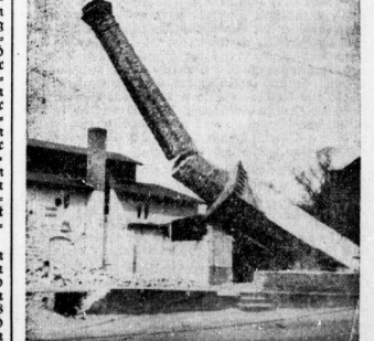
Im Zuge des Abbruchs des ehemaligen Straßenbahndepots am Roßplatz wurde gestern auch der alte Steinsteinturm umgeleert. Unser Bild zeigt die Esse, die gewiß nicht zu den Schönheiten unseres Stadtbildes gehört hat, im Sturz.