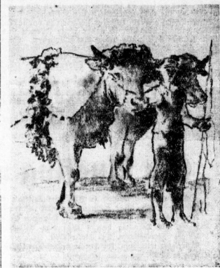
Die "Himmelfahrtssochen, die eine Tonne Bier anfahren.

Niemand in Eisenach mochte, die Obdachlose aufzunehmen, bis ihr endlich ein Einfluß, der Bischof Gebhard von Bamberg, auf einem Schloß Pottenstein einen Aufenthalt gewährte. Kurze Zeit später rief Heinrich Raspe Elisabeth nach der Wartburg zurück und legte sie in den Besitz ihres Wittums. Da sie jedoch in Zurückgekommenheit zu leben wünschte, wies er ihr durch die Vermittlung des Bambergers Bischofs im Jahre 1233 die Stadt Marburg mit allen dazu gehörigen Dörfern und Einkünften als Wittum an und legte ihr ein jährliches Einkommen von 500 Mark Silber aus. In Marburg führte Elisabeth ein Hospital, in dem sie nur der Königin und der Kranken