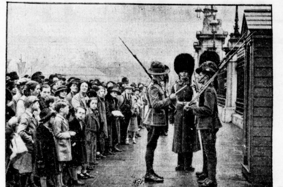
Dominion-Wache vor dem Buckingham-Palast Zum erstmaligen in der englischen Geschichte haben Truppende der britischen Dominion's Wachen vor dem Königspalast in London gestellt. - Unser Bild zeigt die Ablösung einer Wache der australischen Krönungstruppen, die viele Zuschauer anlockte.