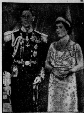
Zur Königskronung in England König Georg VI. und Königin Elisabeth