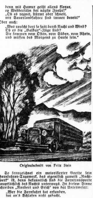
Originalschnitt von Fritz Stein

Sie ist noch nicht ganz erdört, die alte Landstrassenromantik, die uns aus der Zeit der Reifezeit und der Frühfahrtpanoramen überliefert ist. Im Gegenteil: es läßt sich feststellen, daß Automobilromantik und Fernlastfahrerromantik heute, im Zeitalter des Motors und der Reichsautobahn, in neuerlicher Form wiedererstanden sind.