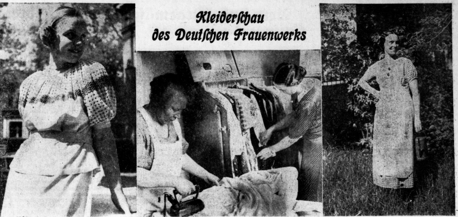
Hellblaues Seidenkleid mit Osmarkeinstückerei (Bericht über die Kleiderschau siehe S. 6)