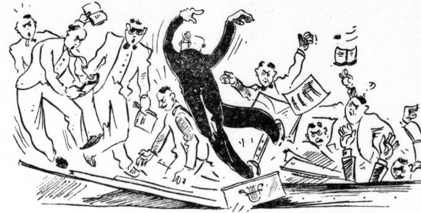
Zeichnung: Horst Keller