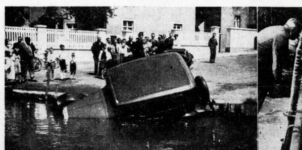
Gestern mittag setzte sich ein in der Nähe der Billberger Fähre aufgestellter unbesetzter Personkraftwagen selbstständig in Bewegung und rollte in die Saale. Von der Feuerlöschpolizei wurde das Fahrzeug unter Mithilfe gerade anwesender Volksgenossen wieder aus dem Wasser gezogen. Personenschaden ist bei dem Unfall glücklicherweise nicht angerichtet worden.