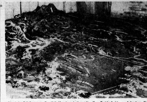
Die riesige Reliekkarte von Gau Halle-Merseburg fertiggestellt. (S. a. Bericht S. 6)