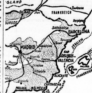
Almeria und die spanische Ostküste

Die Beschießung von Almeria durch ein deutsches U-Boot, das am 27. Mai 1937 in der Bucht von Almeria ein deutsches U-Boot versenkte, wurde gestern amtlich folgendes mitgeteilt: Zur Vergeltung des verwerflichen Angriffs der roten Spanier auf das deutsche U-Boot, das am 27. Mai 1937 in der Bucht von Almeria ein deutsches U-Boot versenkte, wurde gestern in der Morgenstunden von deutschen Streitkräften der besetzte Seebereich von Almeria beschießen. Nachdem die Salvenanlagen gerührt und die gewagten roten Batterien zum Schweigen gebracht worden sind, wurde die Beschießung amtlich abgeschlossen und beendet.