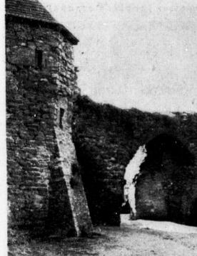
In den Ruinen von Burg Wendelsstein

Das wesentliche Ergebnis der Arbeiten an dieser Stelle war die Aufdeckung des in einem eckigen Einganges zur Krypta. Dieser Eingang, den man lange Zeit für den Anfang eines legendären unterirdischen Ganges gehalten hatte, macht nunmehr auch von der Seite her die Krypta leicht zugänglich, jene noch künstlich in ihrem eckigen Grund erhaltene weisse Halle unter dem Altarraum, die in ihrer alten Wiedergabe selbst einem kleinen Gotteshaus gleicht, von dessen präromanischer Stützgebäude eine erweiternde Erweiterung ausging. Hier, so heißt es, sollen die Kaiserin Kunigunde und ihr Gemahl, Kaiser Heinrich II., im Jahre 1012, nach ihrer Flucht aus Memleben, sich in der Krypta aufhielten.