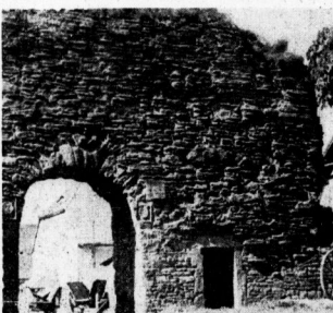
Das allerhöchste „Kaiserstor“