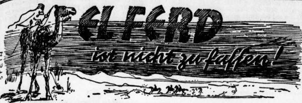
Kampf zwischen Männern und Mächten um Beute und Frauen / Von BILL BEHM

Daß gefascht etwas Sonderbares. Die Weibchen... Kampf zwischen Männern und Mächten um Beute und Frauen / Von BILL BEHM