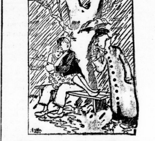
„Sagten Sie nicht, daß es gefährlich ist, wenn einem Baum zu sitzen, wenn es blüht?“