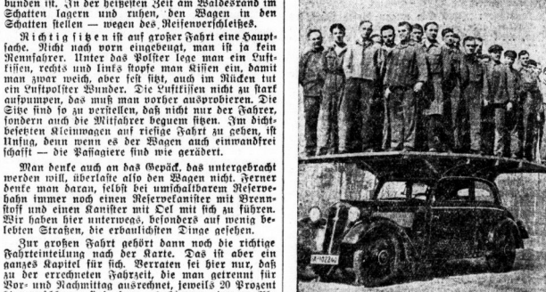
Die Arbeiter der Fabrik...

Wir sind schon mitten in der Urlaubszeit, aber im Juni wird der Automobilverkehr auf der Straße noch größer werden. Immer öfter taucht die Frage für den Kraftwagenbesitzer auf: Sollen wir uns ruhig in ein Fertiges legen oder sollen wir auch selbst versuchen, ein solches Fahrzeug zu erwerben? Das ist die Frage, die sich jedem Kraftwagenbesitzer stellen muß, und die nicht leicht zu beantworten ist. Denn wenn man sich für ein Fertiges entscheidet, so muß man sich auf die Kosten einstellen, die für den Kauf, die Versicherung, die Steuer, die Reparatur und die Unterhaltung des Fahrzeuges anfallen. Wenn man sich für ein selbstgekauftes Fahrzeug entscheidet, so muß man sich auf die Kosten einstellen, die für den Kauf, die Versicherung, die Steuer, die Reparatur und die Unterhaltung des Fahrzeuges anfallen. Wenn man sich für ein selbstgekauftes Fahrzeug entscheidet, so muß man sich auf die Kosten einstellen, die für den Kauf, die Versicherung, die Steuer, die Reparatur und die Unterhaltung des Fahrzeuges anfallen.