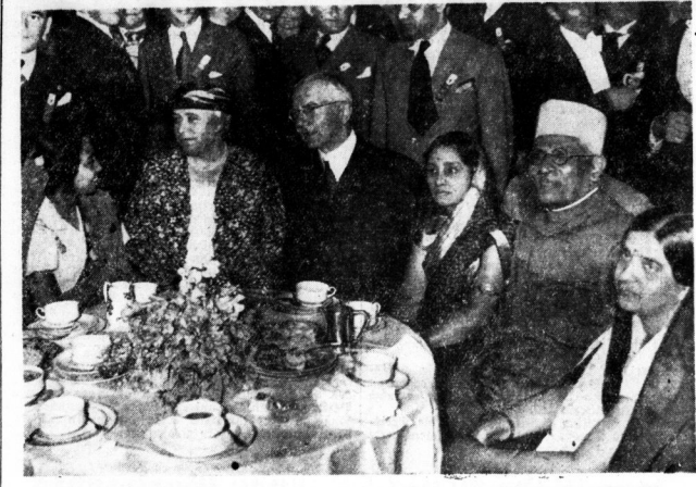
Empfang der Internationalen Handelskammer durch Dr. Schacht. Gestern fand im Weißen Saal des Berliner Reichstages ein Empfang durch Reichsbankpräsident Dr. Schacht...