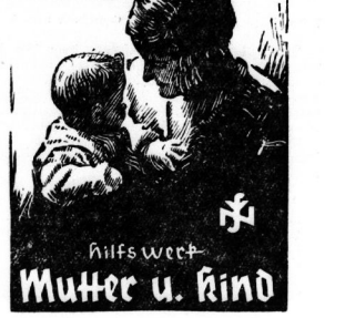
„Ruh mehr!“ erwiderte Boriniffi...