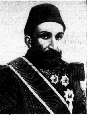
Sultan Abdul Hamid