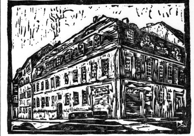
Das Geburtshaus Händels. Linolschnitt von W. Danz

waren. Dieses falsche Händelhaus gemamt mit seinem Schmutz alle Empfinden für sich. Wenn auch ein stimmungsvoller Händelfeier schon 1806 auf das halle'sche Saus Hingewiesen hatte, um die Gründung jenseitiger 1880 topographisch die Umgebung genauer historischer Betrachtung gegeben hätte.