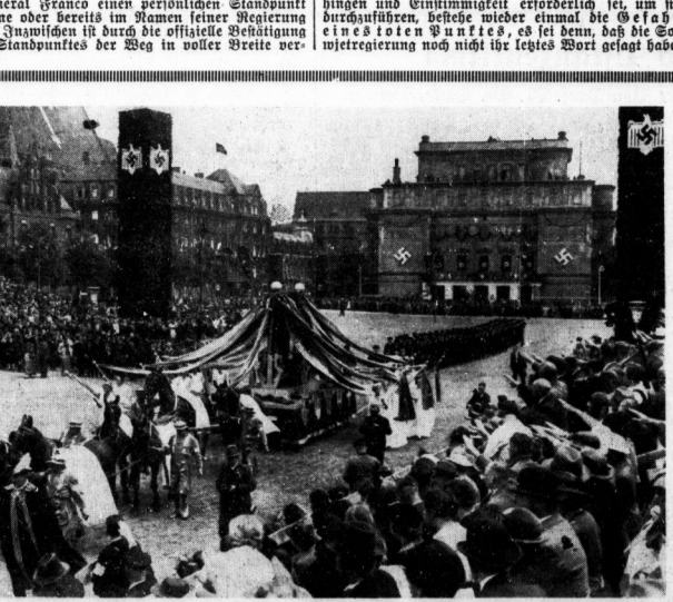
Das Banner des deutschen Sangerbundes wird in festlichem Zuge nach dem Breslauer Schlossplatz zur Uebergabe gefahrt.

hant. Eine neue Lage wurde nach sowjetrussischer Ansicht erst entstehen, wenn der letzte auslandische Kriegsteilnehmer Spanien verlassen hat, und zu den auslandischen Kriegsteilnehmern rechnet Moskau ausdrucklich die maroccanischen General Franco. Nur in diesem Falle ware vielleicht an eine Diskussion der Kriegserende zu denken. Das englische Kommando wird also von der Komjunion abgelehnt, die sich darin wieder durch England noch, wie man hier hinzufugt, durch franzosische Vorstellungen wird betreten lassen. Die sowjetrussische Diktation wird unter diesen Umstanden als der Hauptfaktor der heutigen Sitzung angesehen und von der Presse je nach der grundsatzlichen Einstellung zur Nichtteilnahmspolitik beurteilt oder begrut.