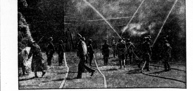
Schutz der deutschen Ernte vor Brandgefahr Im Rahmen der Aufklärungsaktion „Schützt die deutsche Ernte vor Brandgefahr!“ fand unter Teilnahme von leitenden Persönlichkeiten der Freiwilligen Feuerwehr eine Löschvorführung der Feuerwehrschieß-Karrikat bei Beskow statt. ...