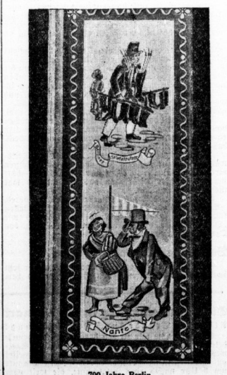
700 Jahre Berlin Die Reichshauptstadt rüstet für ihre 700jährige Geburtsfeier auf dem Ausstellungsgelände am Kaiserdamm eine große Freiland-Ausstellung. ...