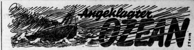
Wie das Seemot vom Geheimnis seltsamer Schiffskatastrophen auf die Spur kam