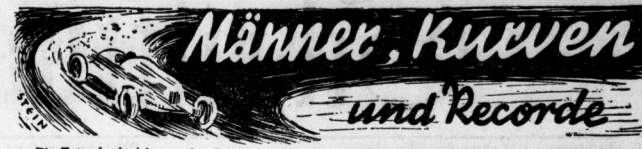
Ein Tatsachenbericht aus der Geschichte des Automobil-Rennsports von Alex Büttner und Fred Fees