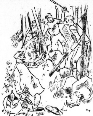
Zeichnung: Horst Keller