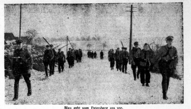
Blau geht vom Petersberg aus vor.

Die Hitlerjugend des Standortortes Halle führte am gestrigen Sonntag im Mann zwischen Weidersee und dem Petersberg ein großes Geländespiel durch, das einen überaus interessanten Verlauf nahm. Die Teilnehmerzahl betrug 1000 Mann, darunter 400 Hitlerjugendler, 400 Wehrmachtsangehörige und 200 Mitglieder der Sonderabteilungen. Das Spiel wurde von der Obergebietsführung geleitet und wurde in drei Phasen unterteilt. In der ersten Phase wurden die Teilnehmer in vier Gruppen eingeteilt, die jeweils einen bestimmten Bereich des Geländes zu erobern hatten. Die zweite Phase bestand darin, die eroberten Gebiete zu verteidigen, während die dritte Phase die endgültige Entscheidung brachte. Die Teilnehmer zeigten eine hohe Kampfmotivation und eine ausgezeichnete Zusammenarbeit. Die Wehrmacht und die Sonderabteilungen leisteten wertvolle Unterstützung und halfen bei der Organisation des Spiels.