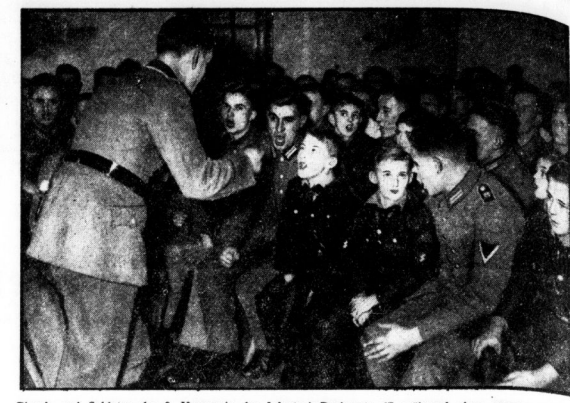
Pimpe und Soldaten der 9. Kompanie des Infanterieregiments 67 während eines gemeinschaftlichen Liederabends in der Alexanderkaserne in Berlin-Ruhleben. In bunter Reihenfolge wechselten Soldatenlieder mit Liedern der HJ. ab.

Fast zwei Monate — genau 111 Tage — hat eine 27-jährige Patientin in einem Londoner Hospital in völliger Bewusstlosigkeit gelegen. Sie hatte schwere Kopfverletzungen davongetragen, als sie vom Dach eines Krankenhauses aus das Straßenpflaster hinabgestürzt war. Jetzt ist sie plötzlich für einen kurzen Augenblick aus dem monatelangen Dämmerschlaf erwacht. Ihre erste Frage an ihre Pflegerin war: Wie spät ist es eigentlich? Sie hatte keine Ahnung, daß sie nicht nur ein paar Stunden, sondern volle 111 Tage geschlafen hatte. Wenn die Patientin auch später noch unzusammenhängende Worte vor sich hinmurmelte, ist sie seitdem doch noch nicht wieder zu klarem Bewußtsein gelangt. Die Ärzte sind auch der Ansicht, daß noch mindestens ein Jahr vergehen wird, ehe sie wieder endgültig das Bewußtsein erlangt.