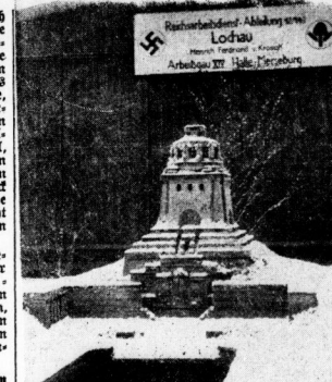
Ein Modell des Völkerschladens