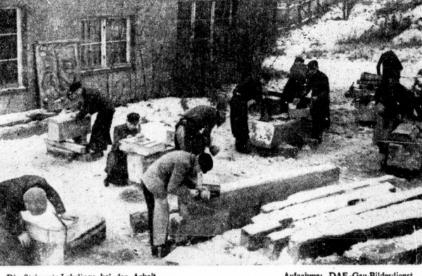
Die Steinmetz-Lehrlinge bei der Arbeit.