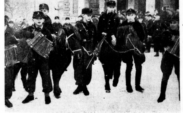
Im Rahmen der Reichsstraßenammlung der HZ. sammelte auch das Fähnlein 28/36 des Jungvolkes mit seinem Pony-Zirkus.

Reges Treiben am Goldenen Sonntag in Halle — Festliche Stunde unter dem Weihnachtsbaum für Alle