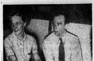
Deutschlands Olympiasieger Maxi Herber und Ernst Baier während einer Pause der Kuff.-Eisssportveranstaltung im Berliner Sportplatz.

wurde der „ritische Punkt“, der bei 48 Meter liegt, mehrmals überflogen. Am weitesten sprang der Jungermann beim 1. Versuch (Hofberg) mit 50,5 Meter. Am ersten Versuch hatte er 49 Meter geflogen, wofür er mit 21,5 die beste Note erhielt. — Auf der Heimfahrt wurde er von einem in der Höhe von 100 Metern (Hofberg) abgesetzt. — Im Sprunghaus wurde er von einem in der Höhe von 100 Metern (Hofberg) abgesetzt. — Im Sprunghaus wurde er von einem in der Höhe von 100 Metern (Hofberg) abgesetzt. — Im Sprunghaus wurde er von einem in der Höhe von 100 Metern (Hofberg) abgesetzt.