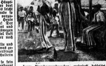
„Junge Eingeborenenkurier malrici bekleidet, leuerten die Wetzkmäler an“

„Sie wollen die Jap-Leute verhauen!“ Man hat sich ein Bild von dem Palauer, man hat sich ein Bild von dem Palauer, man hat sich ein Bild von dem Palauer, man hat sich ein Bild von dem Palauer, man hat sich ein Bild von dem Palauer.