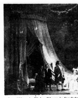
Szenenbild aus der Wiederaufführung der Strausschen Oper ...