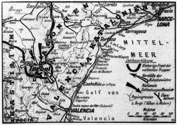
Der Kampf um die spanische Stadt Teruel

Die Menschen sind heute mehr als je zuvor einander verbunden. Die Menschen sind heute mehr als je zuvor einander verbunden. Die Menschen sind heute mehr als je zuvor einander verbunden. Die Menschen sind heute mehr als je zuvor einander verbunden. Die Menschen sind heute mehr als je zuvor einander verbunden. Die Menschen sind heute mehr als je zuvor einander verbunden.