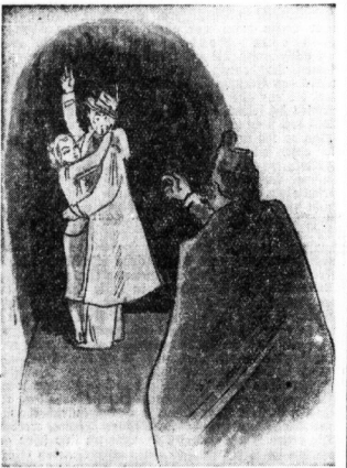
„Nanu, was iss'n da los?“ — „Entschuldigen Sie, Herr Wachmeister, wir haben uns soeben verlobt!“

Herr, das wissen wir. Aber ob es zutreffend ist, daß er sich bereit erklärt gegen Karabomben abzuwehren, das ist fraglich noch zu bemerken.