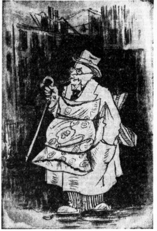
Rechnungen: S. Keller

Er war während der beiden Verdunkelungstage auch unterwegs; wie er behauptet, mit einem fahrbaren Reifwerk, einer Badbox und einer Steuer-