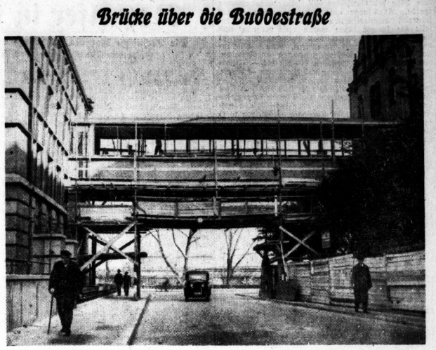
Die Direktionsgebäude der Reichsbahndirektion Halle werden zur Zeit durch eine Brücke verbunden, die ...