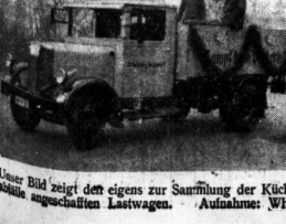
Unser Bild zeigt den eigens zur Sammlung der Küchenabfälle angeschafften Lastwagen.

für das Ernährungshilfswerk hat begonnen