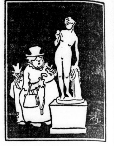
„Aber nicht, was die Kinder so können.“