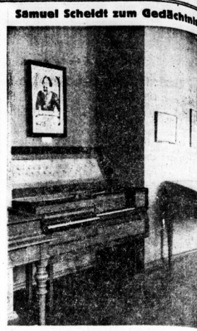
Blick in die Samuel-Scheidt-Ausstellung im hallischen Moritzburg-Museum. Scheidts Bild über einem Kruzifixmal aus seiner Zeit.

Dann legte er los. Er drehte auf der ganzen Strecke herum. Hier befand er sich in der Nähe des Zuges, dort ordnete er an, das ein anderer langsam zu fahren habe. Einen dritten Zug beorderte er an eine bestimmte Ausweichstelle, um dort zu warten. Die Güterzüge wurden von den Nebenstellen auf die Hauptstrecke kommandiert, der künftige Fernverkehr des Expresszuges auf demselben Wege festgelegt. Und — alle Telegramme gab er mit der „Unterstützung“ des Direktors. Das zog da draußen natürlich gewaltig — wer hätte sonst auch auf die Maßnahme eines kleinen Telegrafisten geglaubt, der nichts zu befehlen hatte?