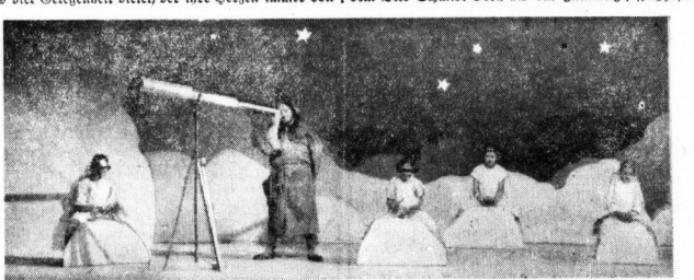
Bei den Sternengeln auf der Mondreise.

Als Weihnachtsmärchen brachte das Stadttheater den Kindern diesmal wieder das Märchenstück von Peterchens Mondfahrt, die traumhafte Geschichte von dem kleinen Jungen und seinem Schmetterling, der ihn auf die schönsten Abenteuer, die dem Kaiserlichen Schemmelfuß sein lange vermisstes festes Heim von Mond herunter und dabei eine Reihe seltsamer Abenteuer zu bestehen haben. Schmetterlingchen stiegen bei jeder neuen Anweisung zu kommen und zu gehen, aber nur wenige von ihnen erleben je eine Wiederkehr.