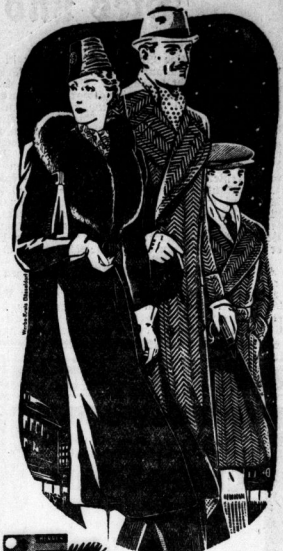
Auf dem Weg