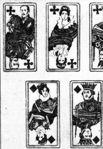
Karten mit Figuren aus den napoleonischen Kriegen