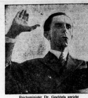
Reichsminister Dr. Goebbels spricht