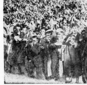
Der Ansturm der Amateurphotographen bei der Ankunft des Reichsministers

Der nicht ein Jahr seines jungen Lebens für den Staat einlegen kann, der verdient es, verurteilt und geächtet zu werden.