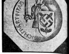
Für den Reichsparteitag 1934 in Nürnberg hat...