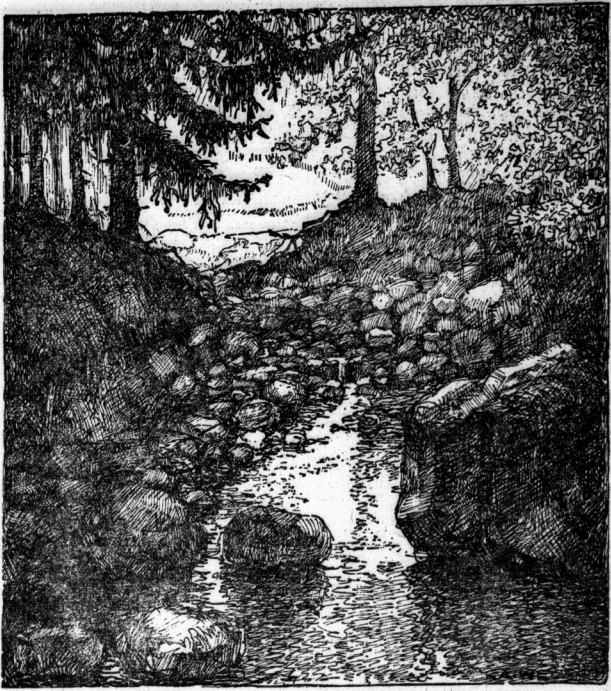
Bei Braunlage im Harz

Nach vierhändigem Mitt hatten wir die White Hills erreicht, nachdem wir aufgebrochen waren, die Sonne anfangen war. Der Mitt durch die unendlich feinen, mogende Luft war für mich ein Genuss gewesen, während Jaws über den Kopf des Berges abgibt und die Spur, die wir verfolgt, beobachtet.