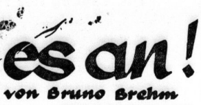
von Bruno Brehm