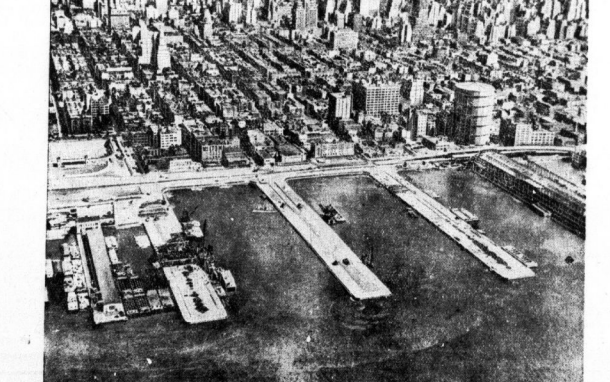
Im Newyorker Hafen sind neue Piers für die Schiffe der deutschen Hagapline im Bau. Sie münden (von links nach rechts) auf die 49., die 51. und 53. Straße der Wolkenkratzerstadt.