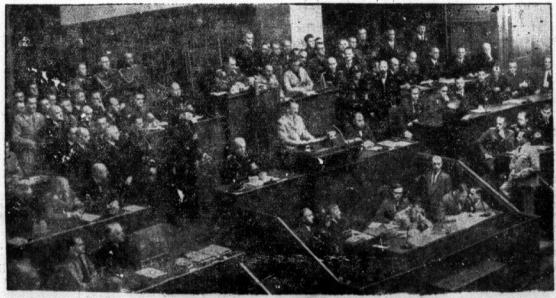
Die denkwürdige Reichstagsitzung vom 14. Juli