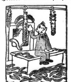
Erzählung des Rouerunternehmens. Sie steht nicht — steht nicht nicht — sie steht nicht nicht nicht!