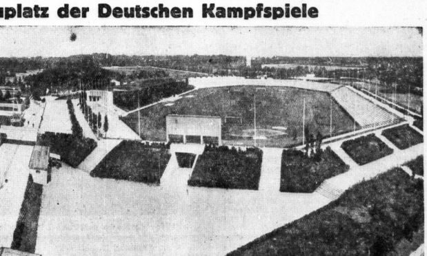
Ein Ueberblick über die Hauptkampfstätte der 'Deutschen Kampfspiele' in Nürnberg. Im Vordergrund rechts die Hauptkampfbahn, rechts dahinter die Zeppelinfeld (bekannt durch den Reichsparteitag)...