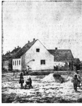
Blick in die neue Siedlung, die unmittelbar jenseits der Kasseler Bahn im Entstehen begriffen ist