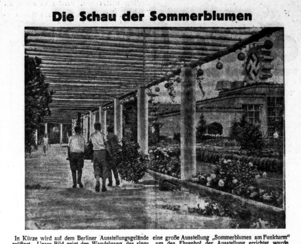
Die Schau der Sommerblumen

Die Kirche Bedeutung des Kriegesbegriffes Die Verordnungen des Reichstages über die Kriegesbegriffe sind für die evangelische Kirche von großer Wichtigkeit. In demselben Sinne ist die evangelische Kirche zu verstehen. In demselben Sinne ist die evangelische Kirche zu verstehen. In demselben Sinne ist die evangelische Kirche zu verstehen.