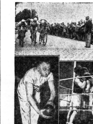
Oben links: der Sieg des RC Wanderer-Chemnitz im 100-m-Mannschaftsfahren...