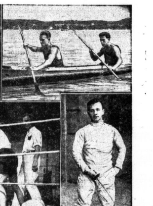
Oben links: der Sieg des RC Wanderer-Chemnitz im 100-m-Mannschaftsfahren...