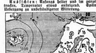
Wetterkarte mit Temperaturangaben und Wettervorhersage für die Region um Halle.