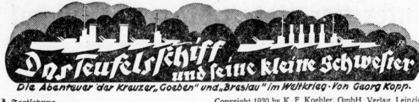
Die Abenteuer der Kreuzer, Goeben und Breslau im Weltkrieg von Georg Kopp.