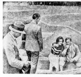
Leni Riefenstahl mit ihren Mitarbeitern bei einer Regievorbesprechung auf dem Aufmarschplatz in Nürnberg.

Ein Zugunglück, das glücklicherweise noch recht glimpflich abfiel, ereignete sich am 29. August auf der Berliner Stadtbahn. Ein Zug fuhr von Potsdam kommend Richtung Berlin. In der Nähe von Wannsee kam es zu einer Kollision mit einem anderen Zug. Glücklicherweise gab es keine schweren Verletzungen.