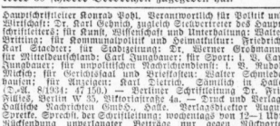
Die vorliegende Nr. der Hollischen Nachrichten umfasst 16 Seiten

Aus Peking wird von einer der unangenehmsten Frauen berichtet, die die neue Regierung kennt. Aus Peking wird von einer der unangenehmsten Frauen berichtet, die die neue Regierung kennt.