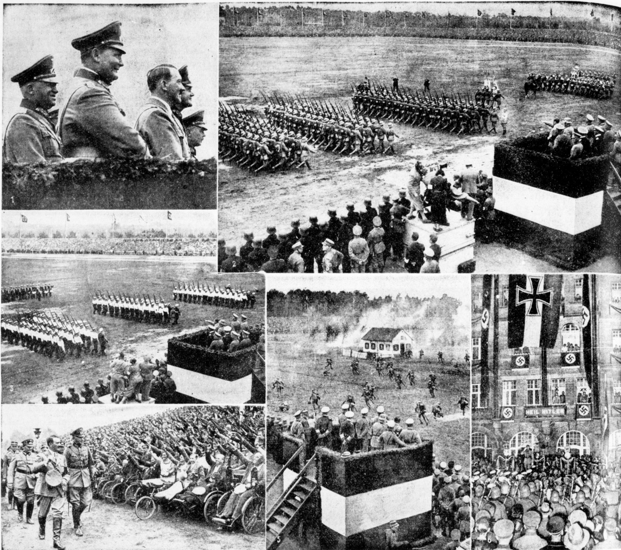
Unsere Bilder zeigen: 1. Der Führer bei den Reichswehrvorführungen. Von links nach rechts: Ministerpräsident Göring, der Führer, Reichswehrminister v. Blomberg und der Chef der Heeresleitung General v. Fritsch -- 2. Vorbereitungen der Reichswehr vor dem Führer -- 3. Reichsmarine beim Vorbeisegeln -- 4. Die Kriegssopha als Zuschauer bei den Reichswehrvorführungen -- 5. Reichswehr zeigt ein Scheingefecht um ein Gefäß -- 6. Der große Zapfenstreich vor dem Hotel des Führers (der Führer x, Göring xx)