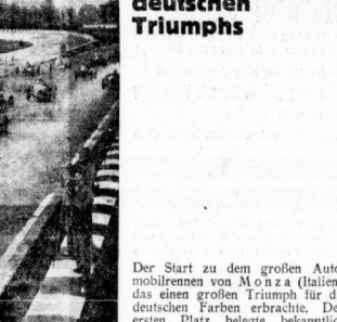
Der Start zu dem großen Automobilrennen von Monza (Italien), das einen großen Triumph für die deutsche Farben erbrachte. Im Vordergrund ist Mercedes, den zweiten Auto-Union.

Die Verfasser der Probleme des Vulkanismus von der geologischen und chemisch-petrographischen Seite angeht. Die Verfasser der Probleme des Vulkanismus von der geologischen und chemisch-petrographischen Seite angeht.